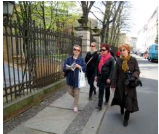
Lisan matkaopaskirja oli kovassa käytössä.