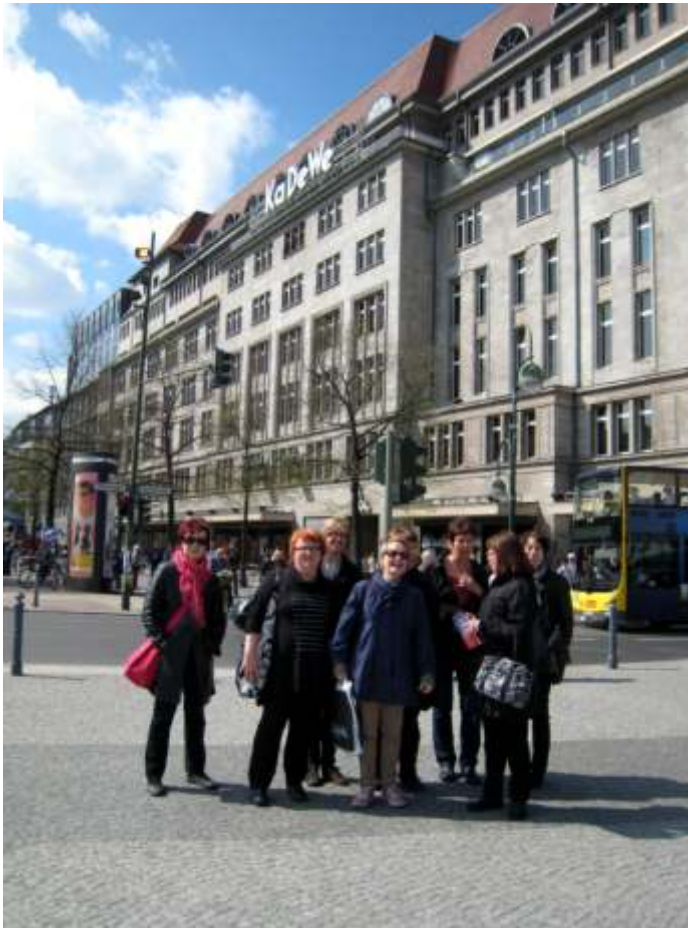
Tavaratalo KaDe We:n herkkuosasto oli tämän osajoukon matkan varrella.