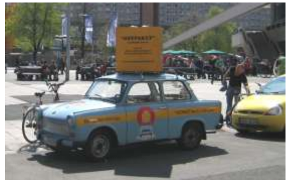
Itä- ja Länsi-Berliinin jako näkyy vielä jossain.