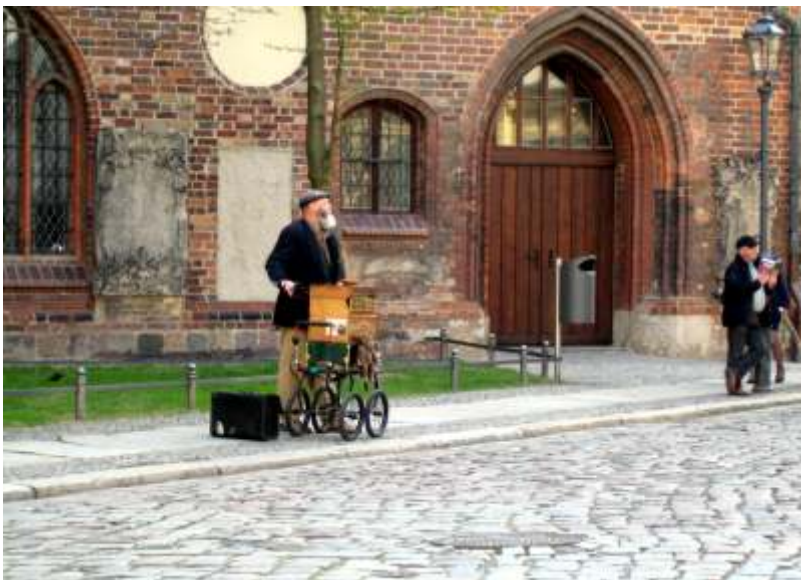
Kilpaileva muusikko ruokapaikan vieressä.