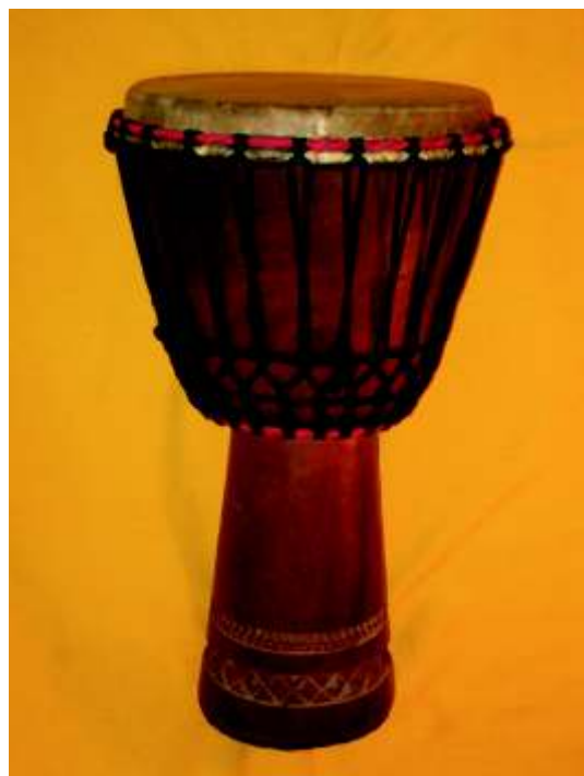
Guinealainen djemberumpu.

Solistilla on oltava myös erinomaiset refleksit löytääkseen nopeasti vaihtuvissa tilanteissa sopiva musiikillinen fraasi tanssijan askelkuvioon, sillä afrikkalainen muusikko seuraa tanssijaa eikä päinvastoin, kuten yleensä länsimaisessa musiikissa.