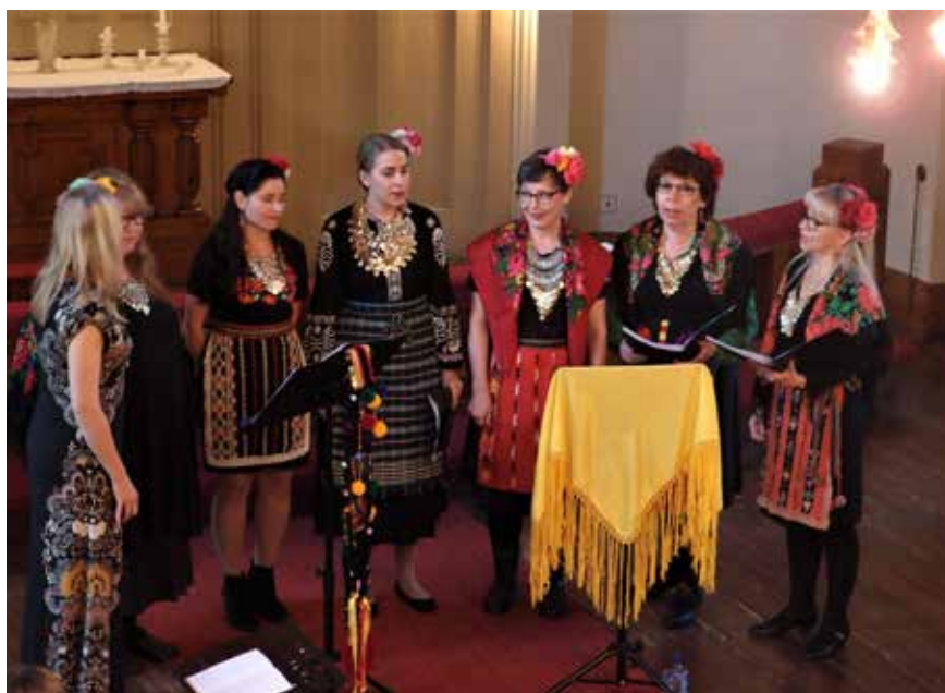
Kukuvitsan vahvuutena on varmat ja persoonalliset naisäänet.