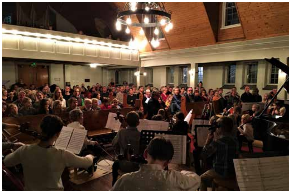
Kirkko oli lähes täynnä kuulijoita, lava soittimia ja soittajia.