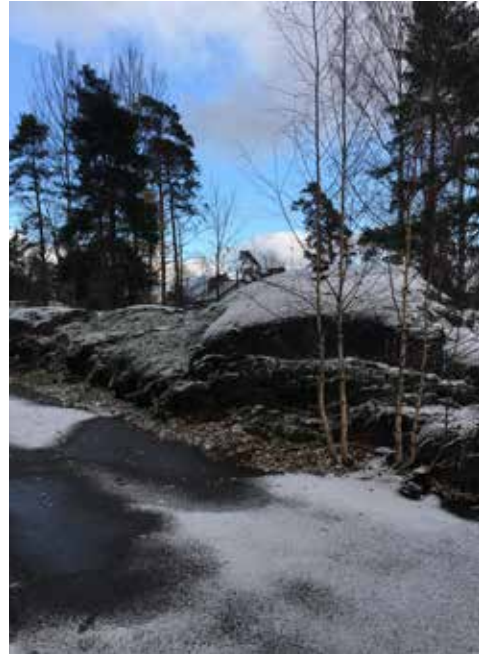
Hätäinen ensilumi tuli ja sulii ma 29.10.18 Taivaskalliontielle.

”Toivon, että se muuttaisi työtapaani. Vähän on jo alkanut tapahtuakin, hitaasti. Toivon, että musiikillisesta keksimisestä tulisi luonteva osa kaikkea opetustani. Taideharrastus on lähtökohtaisesti luova harrastus. Entä jos ei koskaan luoda mitään omaa? On tärkeää päästä keksimään omia