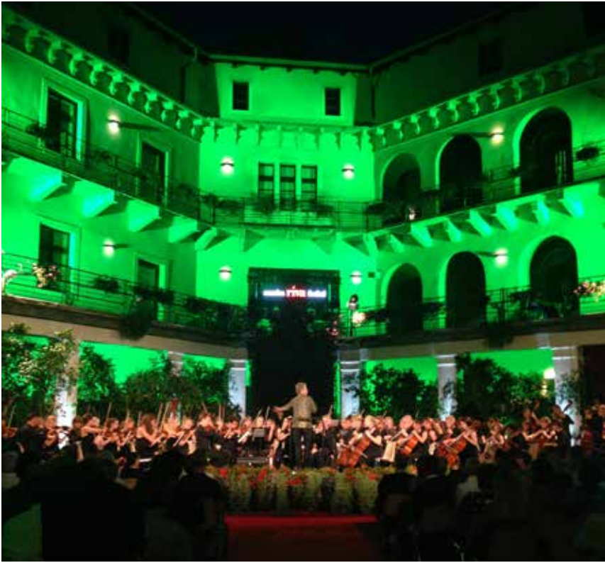
Riva del Garda Cortelie della Rocco

tämän jälkeen siirryimme isäntäperheisiimme illalliselle ja itse ainakin painuin melko nopeasti nukkumaan.