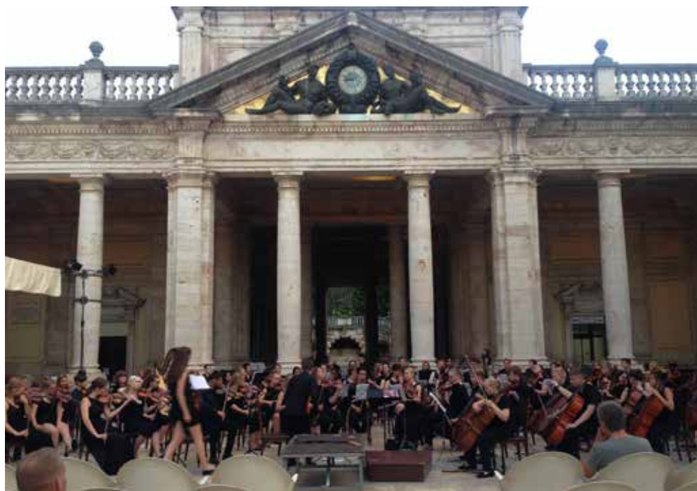
Montecatini, Terme Tettuccioon kenraaliharjoitukset.

Loggia dei Lanziin kaarien alla – Piazza della Signoriassa Firenzen musiikkifestivaalin yhteydessä ja yleisöä oli valtavasti jo harjoitustemme aikana. Konsertti meni erinomaisesti ja kuuntelijoita oli satoja. Konsertti oli ehdottomasti yksi parhaista kokemuksistani. Seuraavat kaksi päivää olivat vapaapäiviä. Ensimmäisenä päivänä kävimme Pisassa ja Luccassa ja toisen päivän vietimme Välimeren rannalla. Vapaapäivien jälkeen oli aika toiseksi viimeiselle konserttillemme, joka pidettiin Cremonassa Cortile Federico II aikealla.