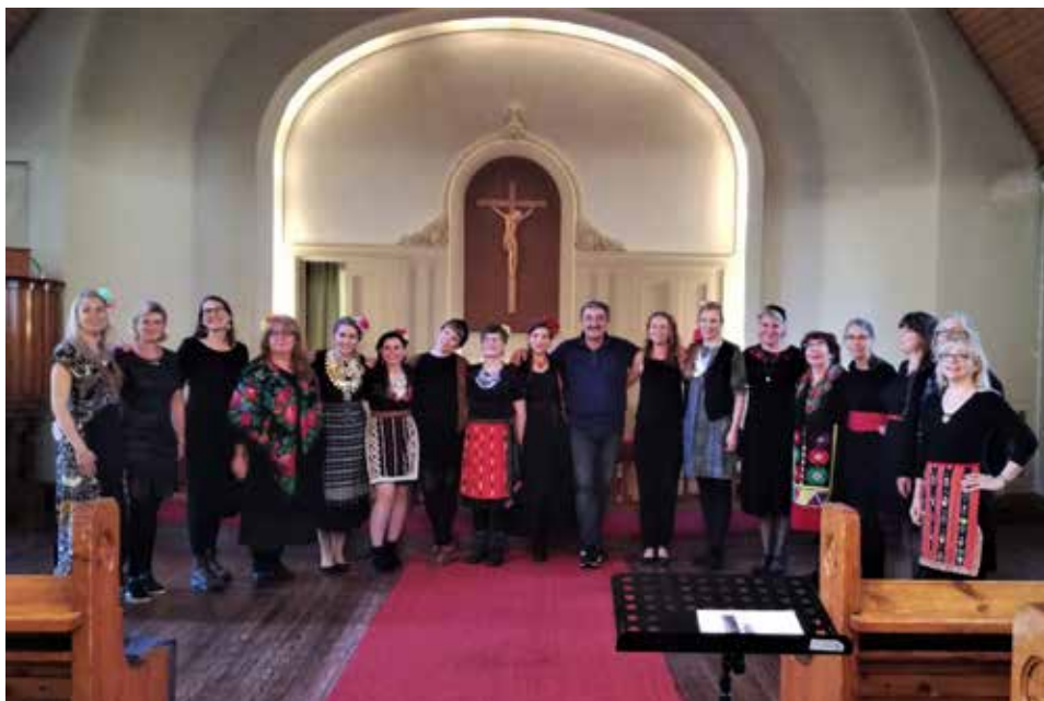
Yhteiskuvassa konsertin jälkeen on helppo hymyillä.