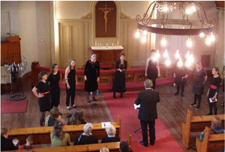
Sedjanka-kuoro esiintyi vakuuttavan tyylikkäästi.

Sedjanka on naiskuoro Tanskan Aarhusista. Kuoro esittää bulgarialaisia kansanlauluja uusilla sovituksilla, kulkien Bulgarian