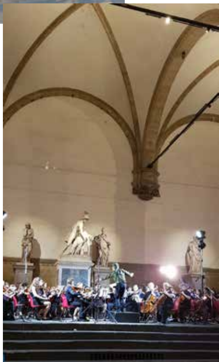
Firenze, piazza della Signoria, Loggia dei Lanzi

Konsertin jälkeen oli aika hyvästellä saksalaiset ystävämme ja ihaillla Gardan yllä olevaa myrskyä. Seuraavan päivän kotimatka sujui mukavasti ja matkasta jäi paljon hyviä muistoja bussimatkoista, illanvietoista, Saksasta, Italiasta ja erityisesti ystäväistämme ja mahtavista konserteista.