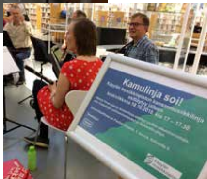
Kamulinjan pelimanniorkesterilla svengaa.