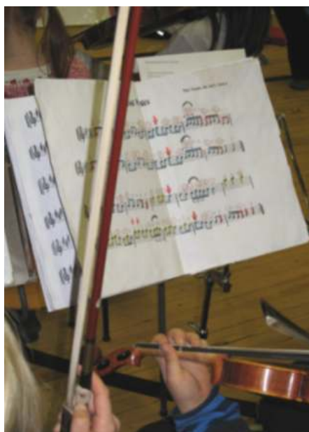
Vuoden 2008 näppärikuotteja Käpylän peruskoululla.

Ks. http://napparit.kpk.fi/ - Kaustisen Näppärit ry:n kotisivut