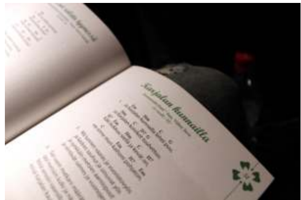
Mökkiläisen laulukirjasta laulettiin viisuja bussimatkan ratoksi.