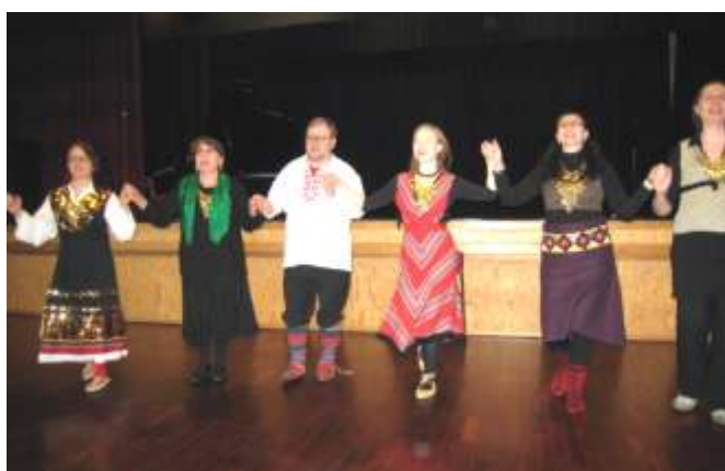
Kukuviitsa -ryhmä vauhdissa.