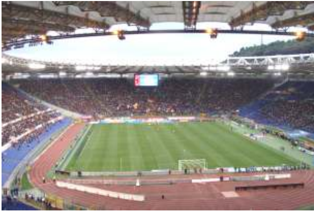
AS Roma - Palermo lauantai-iltana stadionilla - matkan huippukohtia!