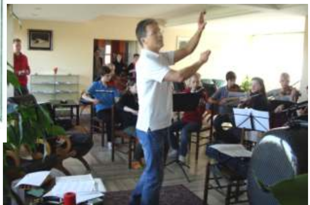
Kaapeli johtaa majapaikassamme Villa Santa Ceciliaassa.