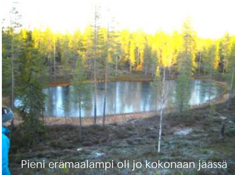
Pieni erämaalampi oli jo kokonaan jäässä.

Ohjelmistomme koostui kahdesta Sibeliuksen teoksesta: Valse Triste sekä Pelleas ja Melisande. Soitimme myös Mozartin 40 g-mollisinfonian ensimmäisen osan.